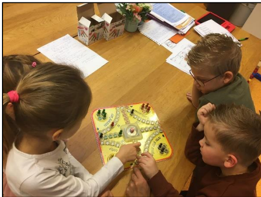
Spelletjes bij de noodopvang