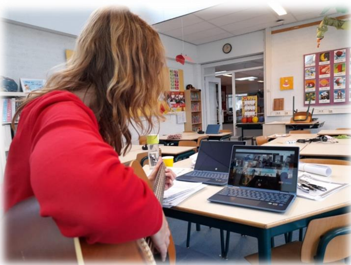
Online muziekles in groep 3