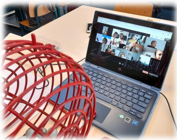
Online bingo in groep 3