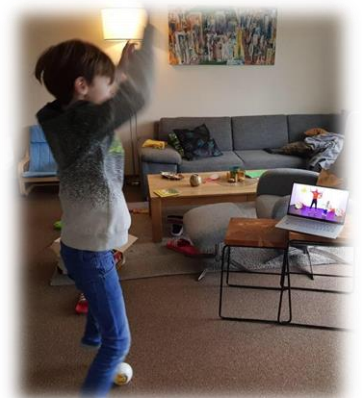
Genoeg bewegen is belangrijk!