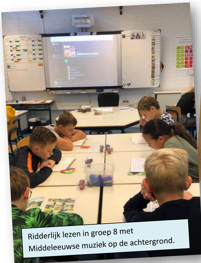
Ridderlijk lezen in groep 8 met Middeleeuwse muziek op de achtergrond.

In alle groepen vinden verschillende activiteiten plaats die passen bij het thema van de Kinderboekenweek.